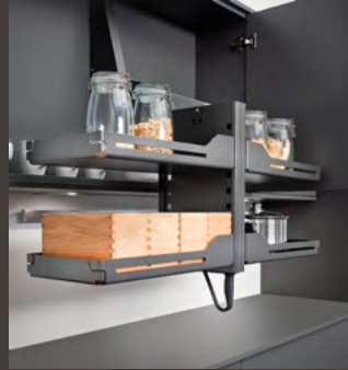
Étagère Libell, anthracite