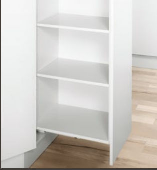
Muebles de madera individuales