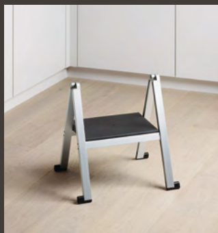
1 gradin, aluminium naturel