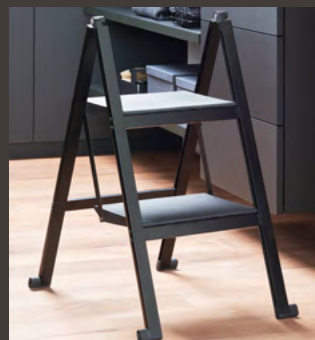
2 gradins, aluminium noir