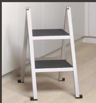
2 gradins, aluminium naturel