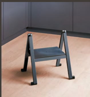
1 gradin, aluminium noir