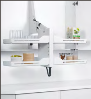
Tablar Libell weiss