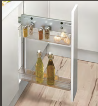
Vaschetta agganciabile, trasparente