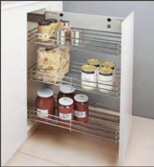
Cesto agganciabile Excellent, cromato